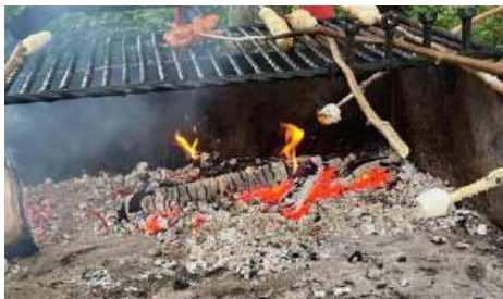
Frauentreff im Buechban