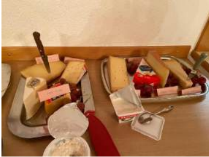
Gschwelli mit Chäs

Impressionen von den Frauenanlässen seit der letzten Herbstausgabe des Niederbuchsiten aktuell