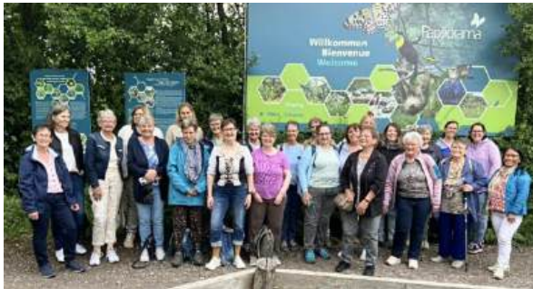
Vereinsreise ins Papiliorama nach Kerzers