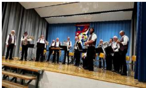
Auftritt in Kleinwangen zum Jubiläum 111 Jahre